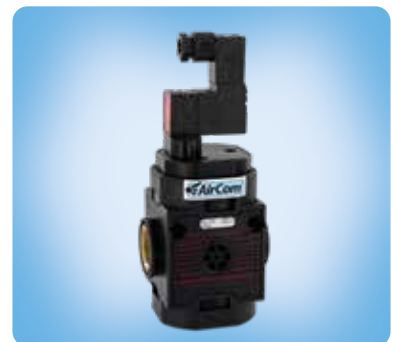
S052 elektrisches Einschaltventil