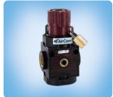
V052 manuelles Einschaltventil

Wahlweise Ausführung, es ist der entsprechende Buchstabe hinzuzufügen 24 V AC, 2 W Anschlussspannung für S0 S0...0.X 115 V AC, 1 W Anschlussspannung für S0 S0...0.Y 230 V AC, 1 W Anschlussspannung für S0 S0...0.Z pneum. Ansteuerung C402600014, statt elektrischer Betätigung für S0 S0...0.P